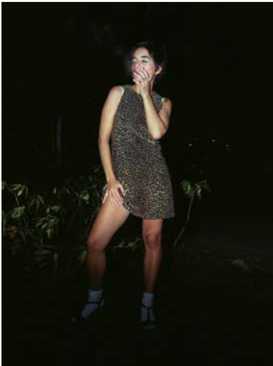
Toutes mes copines sont des putes, 1999

Les photographies de Virginie Marnat-Leempoels recyclent des genres classiques, comme le portrait, les scènes champêtres ou les scènes d'intérieur pour cristalliser des représentations de notre propre société. A travers ses mises en scènes, elle mixe les codes iconographiques de l'histoire de l'art avec des archétypes contemporains issus notamment du cinéma et des séries télévisées.