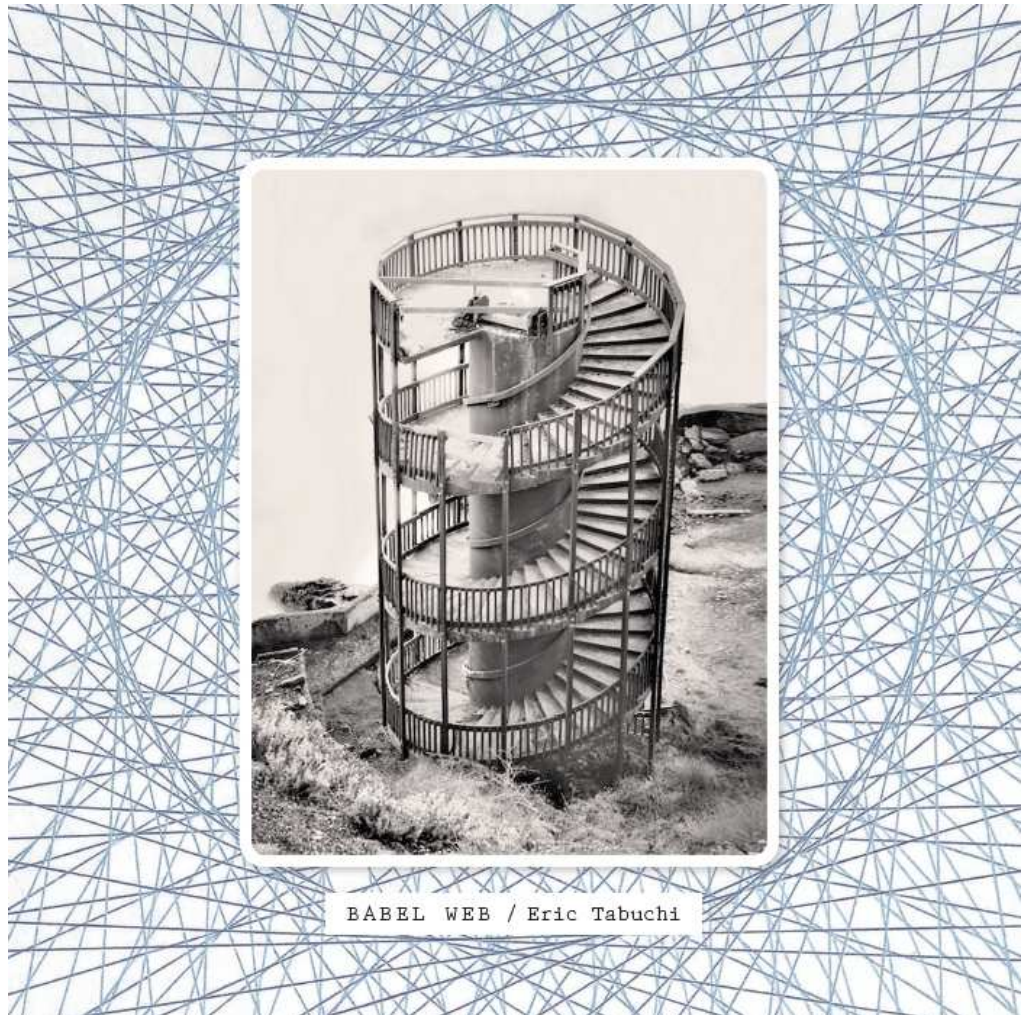
BABEL WEB / Eric Tabuchi