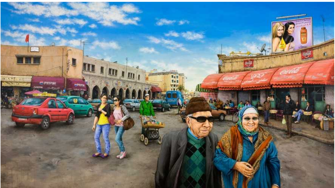
Julien Beneyton, Oujda , 2013, acrylique sur bois, 170 x 306 cm,

2004 Pienkow International Art Workshop, Chelm, PL