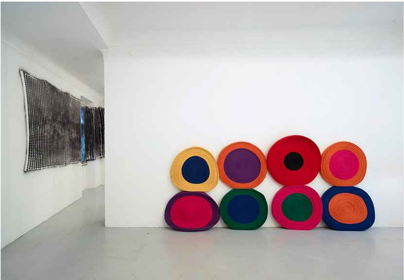
l'adresse, envergure, Installation de 8 sculptures en chute de feutre, diamètre 1,3 m, 2013