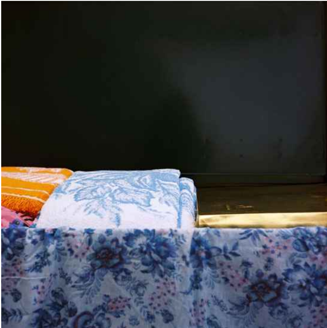
Le trousseau 2005-2009, Cantine1, 2008, Tirage lambda sous diasec, 80 x 80 cm